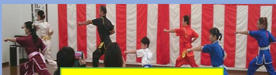
リトルカンフードラゴンズ