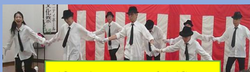
リラックスストレッチ&ダンス