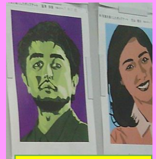
市立習志野高等学校