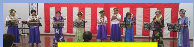
モキハナ&ウクレシ愛好会