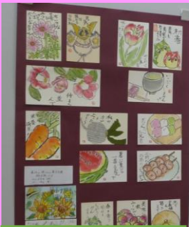
絵手紙の会あじさい