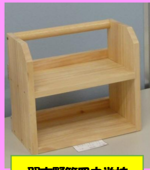
習志野第四中学校