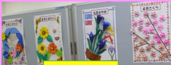
折り紙サロン作品